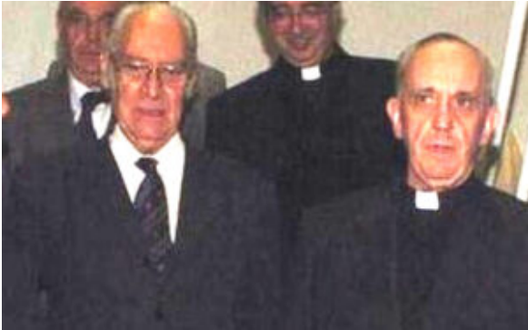
Alberto Methol Ferré

perdita di uno dei due elementi porterebbe «a una deformazione e a una polarizzazione dannosa» (n. 142).